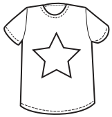
un tee shirt

Do you know the words in French for items of clothing in the pictures below? Write them under the matching picture.